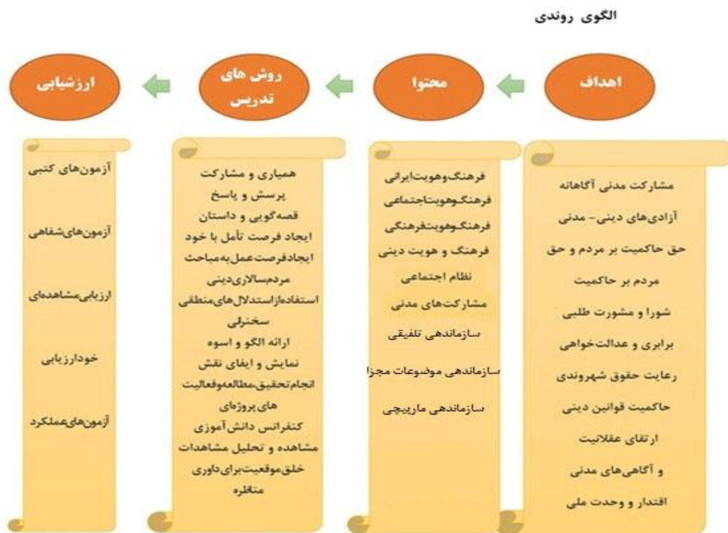
شکل ۲: ترسیم الگوی روندی پژوهش

سازمان دهی فرایندها به متخصصان برنامه ریزی درسی، علوم سیاسی، جامعه شناسی و علوم دینی ارسال شد. این پرسشنامه معیارهای تناسب با اصول مقبولیت، جامعیت و کاربردپذیری این مدل را می سنجد. این معیارها در جدول قابل مشاهده است. افزون بر این به منظور بررسی کیفی روایی محتوا از متخصصان درخواست شد در قالب سؤال باز پاسخ، دیدگاه های اصلاحی خود را به صورت کتبی ارائه نمایند.